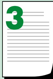
Заява про відкриття рахунка, підписана особою, уповноваженою засновником (див. пункт «1»)