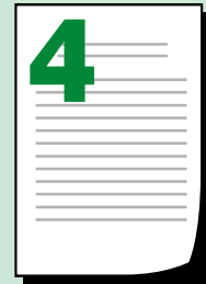
Картка із зразком підпису