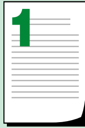
Рішення засновників у вигляді довіреності

Якщо державна реєстрація товариства не відбулася, банк повертає кошти засновникам, учасникам, від яких вони надійшли на рахунок, а рахунок закриває.